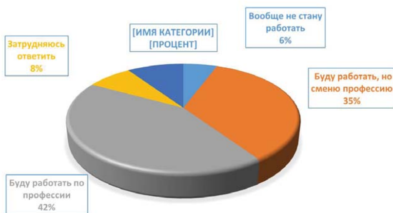
Рисунок 2 – Распределение ответов на вопрос «Представьте себе, что вы получили крупные финансовые средства, позволяющие жить, не работая. Как вы поступите?», % респондентов