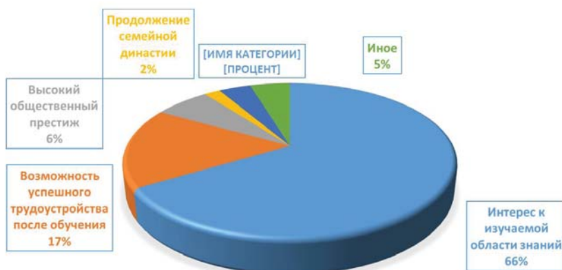
Рисунок 1 – Распределение ответов на вопрос «Что побудило вас выбрать для обучения данное высшее учебное заведение?», % респондентов

В целом, анализ ответов респондентов демонстрирует озабоченность молодежи собственным духовно-нравственным развитием. Студентам свойственно принимать решения,