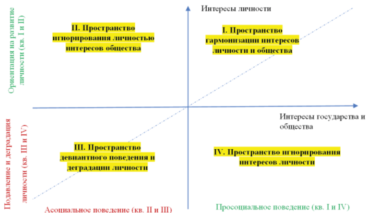
Рисунок 2 – Пространство педагогической реальности и его системы координат

бально, то имплицитно имеют в виду, что оно всегда имеет положительный знак, что, на мой взгляд, противоречит реальности... воспитать можно хорошего человека, религиозного фанатика, бандита, фашиста и т. д., и т. п. То есть воспитание может быть позитивным и негативным [13, с. 51]». Обычно коррекционная педагогика сосредотачивается на индивидуальном уровне, однако, на наш взгляд, коррекционное педагогическое воздействие необходимо не только на индивидуальном, но и на общественном уровне. Рассмотрим и другие квадранты нашей модели (представленной на рис. 1) и дадим им характеристику (рис. 2). Если рассмотренный нами I квадрант отражает пространство гармонизации интересов личности и общества, то в других квадрантах, воспитуемый, не будучи приобщен к определенным ценностям отклоняется в ту или иную сторону от гармоничного развития. Верхняя часть графика (квадрант I и II) отражает ситуацию ориентации воспитательной системы на развитие личности, но если в I квадранте это развитие идет в гармонии с интересами общества и государства, то во II квадранте «игнорирования личностью интересов общества» проявляется индивидуализм, когда индивидуум, исходя из своих интересов, может