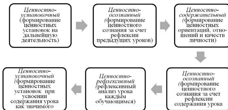
Рисунок 1 – Этапы реализации технологии ценностного обучения Ю.С. Репринцевой

Характерной особенностью мастерских ценностных ориентаций является отсутствие оценки и критических замечаний к участникам, то есть каждый имеет право на свое мнение, свое решение заданий, на самооценку и самокоррекцию. Принцип взаимодействия в мастерских – диалоговость и сотрудничество через парную или групповую формы работ, которые позволяют рассмотреть проблемное задание и полученный новый продукт с различных точек зрения.