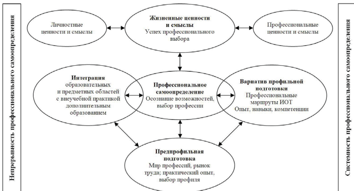
Рисунок 1 – Ценностно-смысловые ориентиры профессионального самоопределения

Понятие «самоопределение» раскрывается через внутренний стержень человека – совокуп-