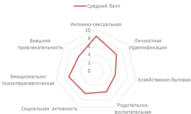
Рисунок 3 – Выраженность компонентов социально-ролевого блока (по методике А.Н. Волковой «Ролевые ожидания и притязания в браке» (РОП)