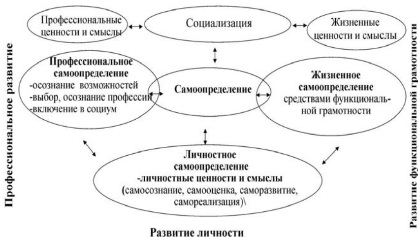
Рисунок 2 – Диалектика взаимосвязи ценностно-смысловых концептов самоопределения, профессионального самоопределения, функциональной грамотности