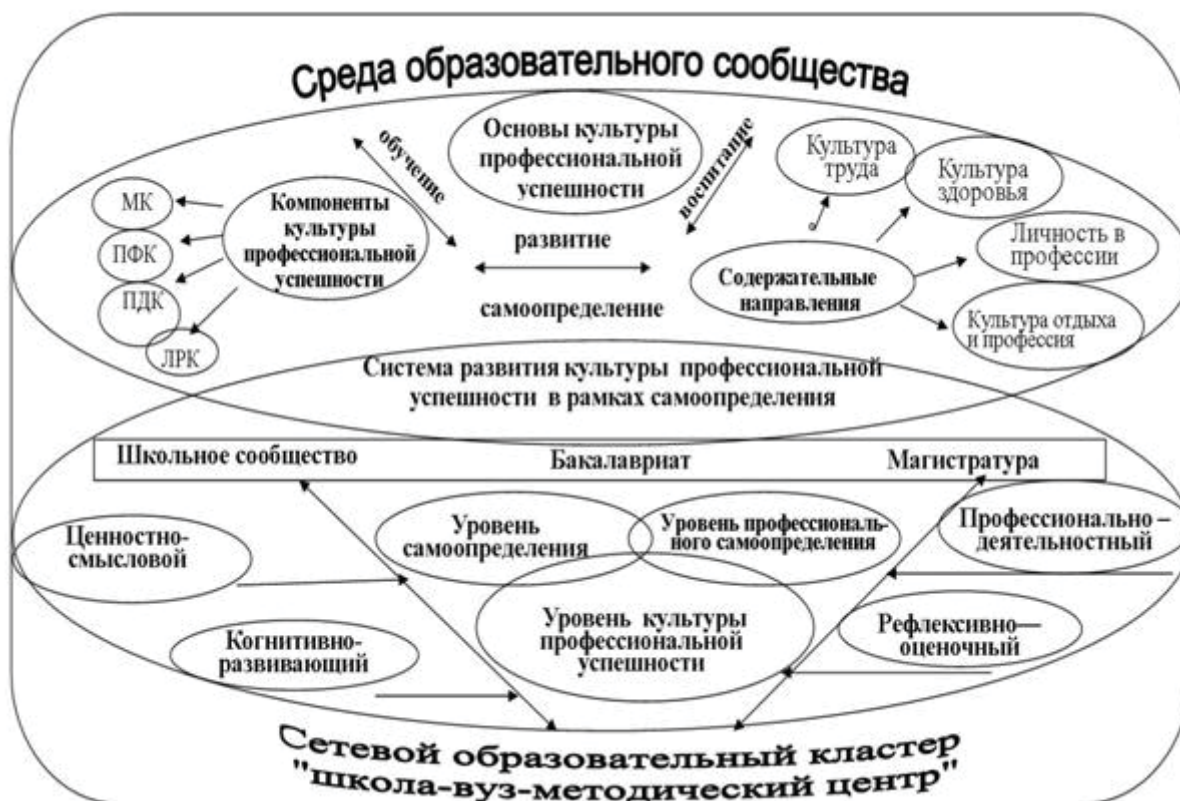
Рисунок 1 – Система развития культуры профессиональной успешности в сетевом взаимодействии

В ходе дальнейшего продвижения по курсу «Культура профессиональной успешности будущего учителя», обучающиеся на всех этапах знакомились с основами культуры умственного труда, раскрывали вопросы сохранения физического, психического здоровья учителя, выполняли тренинговые упражнения по совершенствованию психолого физиологических ка-