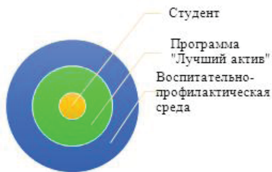
Рисунок 1 - Формирования воспитательно-профилактической среды университета.

Цель нашего исследования: доказать, что обучающиеся, задействованные в реализации