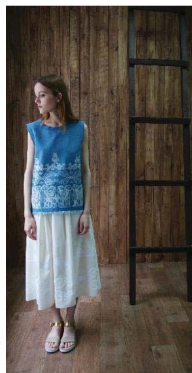
Рисунок 6 – Модель N 2 из коллекции «Предчувствие Великой степи»

Вторая модель (рисунок 6) состоит из юбки и блузы. Юбка молочного цвета выполнена из натурального шёлка, по низу декорирована орнаментом белого цвета в технике росписи по ткани. Блуза выполнена из джинсового материала сине-голубого цвета, от линии груди до низа изделие декорировано орнаментом в технике вытравления.