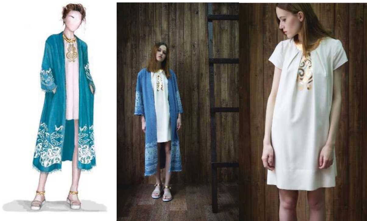
Рисунок 7 – Модель 3 из коллекции «Предчувствие Великой степи»