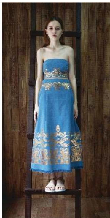
Рисунок 5 – Модель 1 из коллекции «Предчувствие Великой степи»

Поэтому основными цветами коллекции стали натуральные оттенки кораллового, молочного, индиго. Так же, как и в аутентичных сарматских одеяниях, для изготовления коллекции использовались только натуральные ткани: хлопчатобумажный деним, белое шелковое полотно и батист (50% – х/б, 50% – шелк). Далее представим техническое описание моделей современной коллекции женской одежды, разработанной на основе результатов исследований, выполненных в эскизах и их версию в материале.