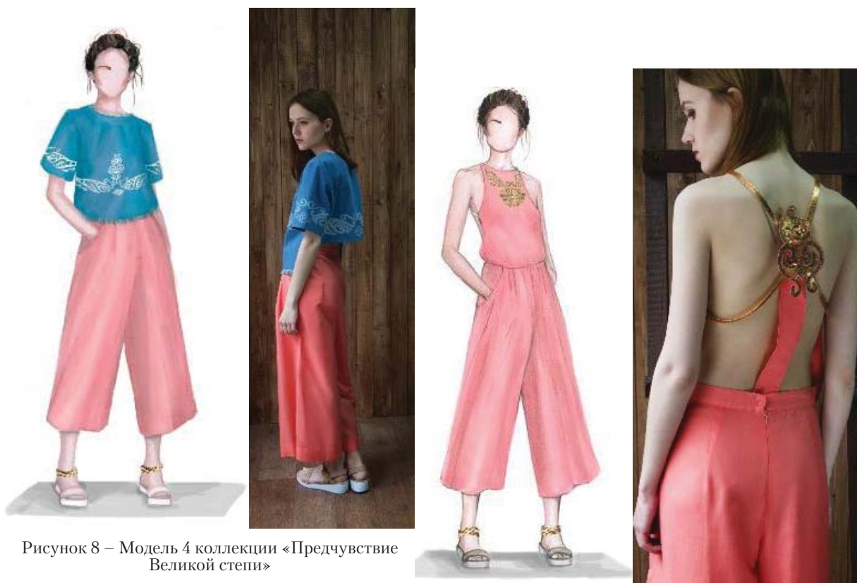
Рисунок 8 – Модель 4 коллекции «Предчувствие Великой степи»