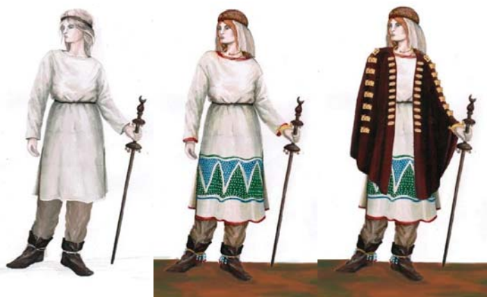
Рисунок 3 – Графическая интерпретация образа сарматской женщины, выполненная студенткой гр. 09ДК Кабылкиной М. на основе научных данных