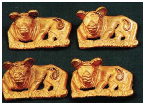
Рисунок 2 – Нашивки на плащ в виде лежащего кошачьего хищника

Так как текстиль в захоронениях Филипповских курганов не сохранился, студентами в графической интерпретации костюма изображен материал, приближённый к зафиксированному археологами в синхронных «замороженных»