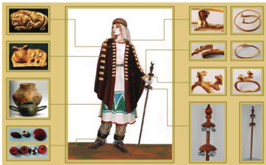
Рисунок 4 – Графическая интерпретация образа сарматской женщины, выполненная студенткой гр. 09ДК Кабылкиной М. на основе научных сведений археологов

В процессе работы над коллекцией использовались три техники декорирования: поталирование, вытравление, роспись ткани. Подбор цветовой гаммы материалов для коллекции также осуществлялся с учетом тенденций моды.