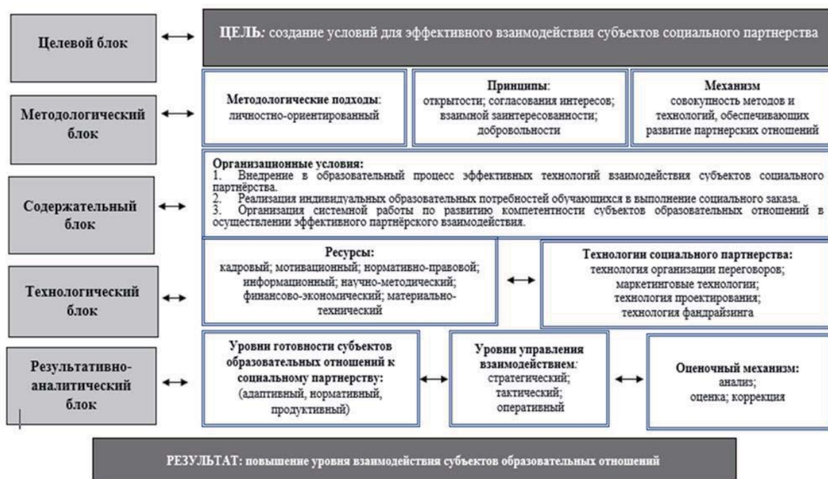
Рисунок 2 – Система формирования социального партнерства образовательной организации

К основным ресурсам мы относим кадровый, мотивационный, нормативно-правовой,