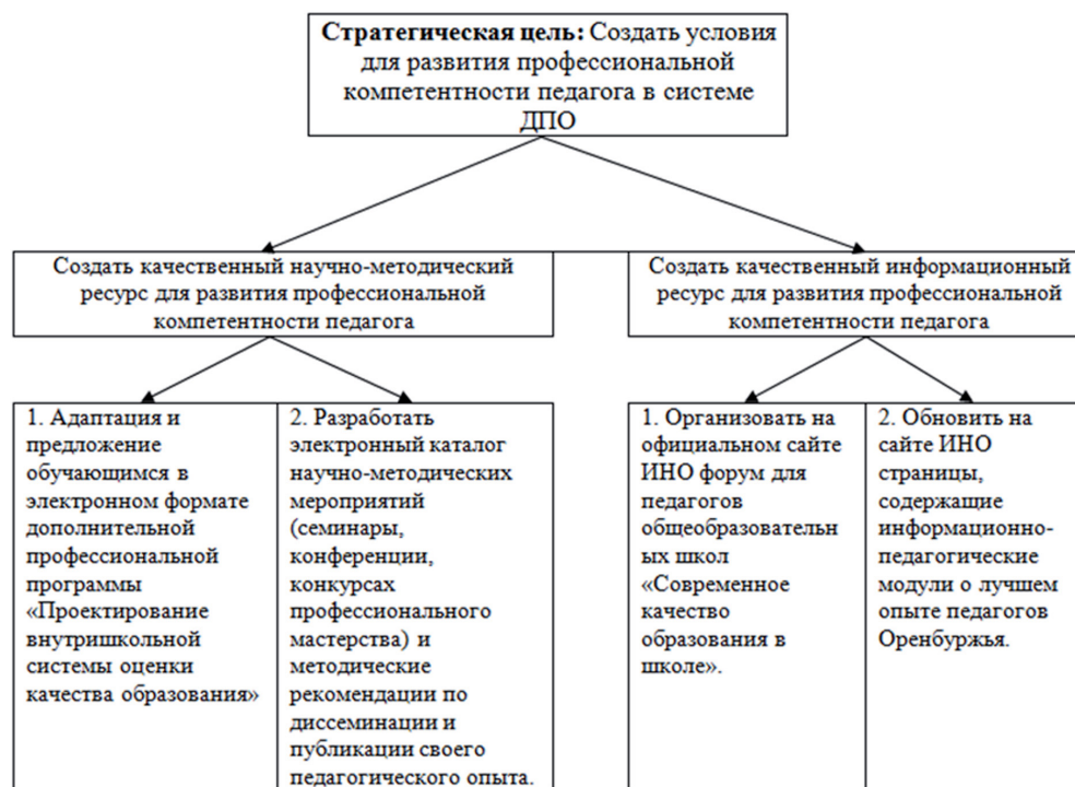
Рисунок 2 – Уточненная модель управления развитием профессиональной компетентности педагога в системе ДПО