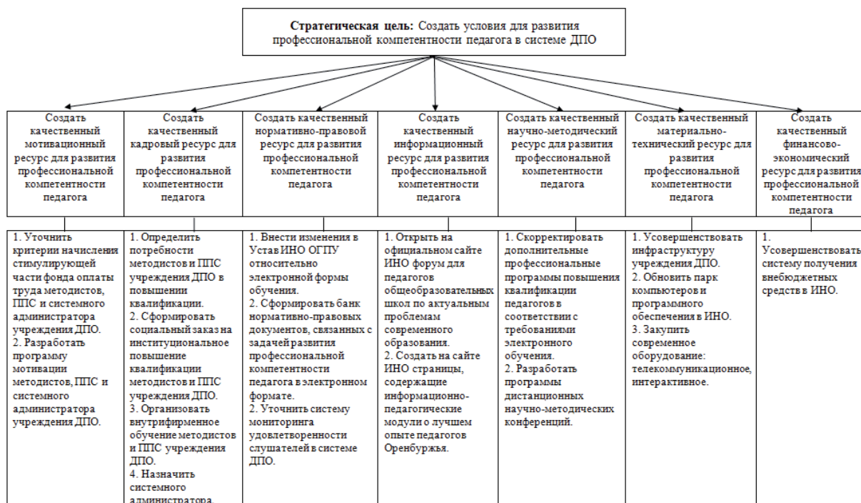
Рисунок 1 – Модель управления развитием профессиональной компетентности педагога в системе ДПО