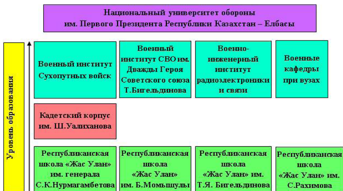
Рисунок 1 – Система военного образования Республики Казахстан