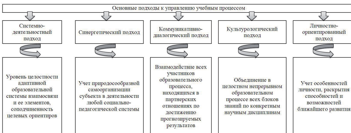
Рисунок 1 – Основные подходы к развитию образовательной организации [3], [4], [11]

В качестве современных принципов управления, по мнению Т.И. Шамовой, П.И. Третьякова, Н.П. Капустина, А.Ф. Родичевой отмечаются такие, как лояльность к работающим, ответственность (обязательное условие успешного управления, коммуникации), пронизывающие организацию сверху вниз, снизу вверх и