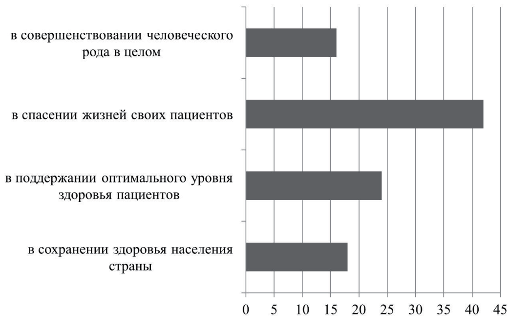
Рисунок 2 – Распределение мнения студентов об основной цели врачебной деятельности, и%

Содержательной основой работы, направленной на достижение глубокого ценностного самоопределения студентов медицинского вуза в профессии, стало комплексное учебное, практико-ориентированное сопровождение,