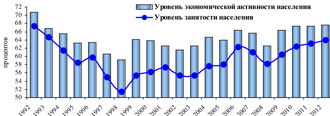
Рисунок 1. Уровень экономической активности и уровень занятости населения Оренбургской области в возрасте 15–72 года

2. Несбалансированность спроса и предложения. В службу занятости попадает только часть рабочих мест в виде заявленных предприятиями и организациями вакансий. По официальным данным, в государственных службах трудоустройства регистрируется порядка 12% вакантных рабочих мест [1]. Большая их часть, особенно, престижных рабочих мест, заполняется работодателями самостоятельно. Таким образом, значительный сегмент рынка рабочих мест остается вне контроля со стороны государственной службы занятости. Также встречается и обратная ситуация, когда спрос и предложение находятся в полном рассогласовании. Рынок труда – конкурентный рынок. В силу чрезвычайной сложности его структурно-функциональной организации всегда существует определенное несоответствие между рабочими местами и трудовыми ресурсами. Часть рабочих мест, требующих своего замещения вы-