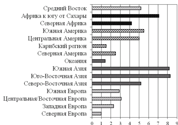
Рисунок 2. Среднегодовой (с 2005 по 2012 гг.) прирост международных туристских прибытий, % (составлено по [1])