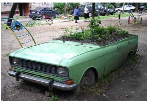
Рисунок 6. «Самодельный» элемент благоустройства выполненный инициативной группой, в рамках Марафона «Делай Сам»