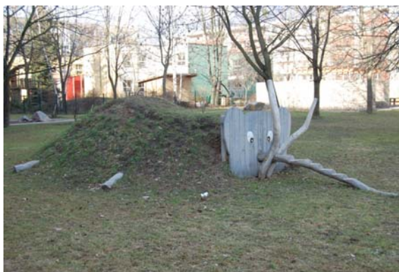
Рисунок 2. Элемент благоустройства дворового пространства микрорайона Пролис, Дрезден, Германия

В конце XX века набирают популярность общественные движения по самодеятельному преобразению городского пространства, появляются некоммерческие общественные организации по планированию ландшафта жилых территорий. Например, коллективный сад, как под-