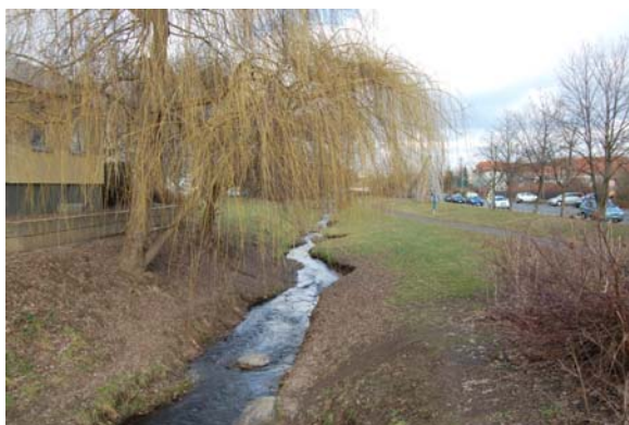
Рисунок 3. Восстановленный ручей в микрорайоне Горбитц, Дрезден, Германия