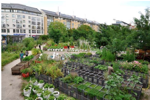
Рисунок 5. Коллективный сад «Сады принцесс», Берлин Германия

рактерна многим дворовым сообществам в России. Можно предположить, что это связано с осознанием жителей чувства собственности и пониманием того, что без активной гражданской позиции не отстаивать своих интересов (рис. 7).