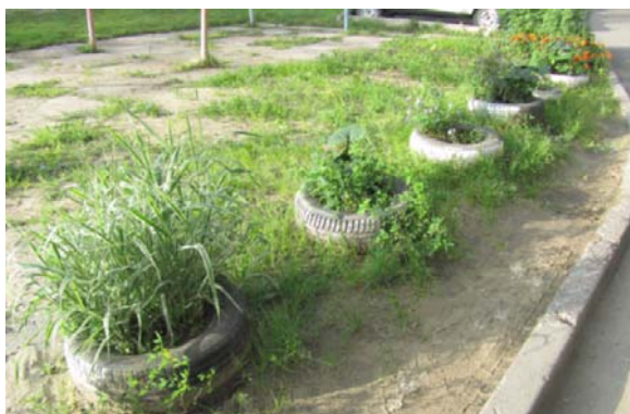
Рисунок 7. Самодельные коллективные клумбы жителей в микрорайоне Солнечный