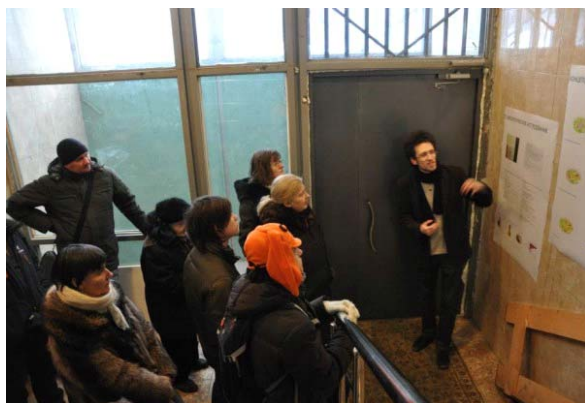
Рисунок 4. Процесс социального обследования группой активистов «УрбанУрбан» в микрорайоне Тропарево-Никулино в Москве

Тенденции формирования некоммерческих организаций активистов в планировании ландшафта жилых территорий развиваются и в других странах вплоть до совместного производства «чистых», преимущественно традиционных растительных продуктов питания в жилой среде. Например, в центре микрорайона Mole Hill (Ванкувер, Канада) местными жителями пешеходная аллея превращена в зелёную сеть съедобных растений и садов. «Зелёные продовольственные» городские площадки разрабатываются на крышах домов, во дворах и прочих местах. «Общественные сады» разбиты в новых городских эко-микрорайонах