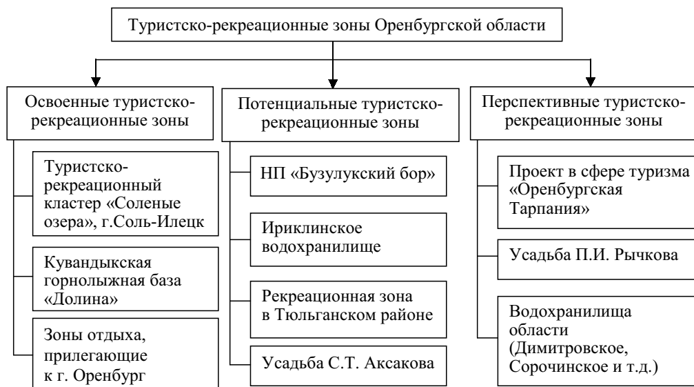
Рисунок 1. Предлагаемая группировка туристско-рекреационных зон Оренбургской области

Территория, прилегающая к г. Оренбургу обеспечена достаточно большими потоками посетителей, проводящими выходные дни за городом. В связи с транспортной доступностью пользуются спросом такие места для отдыха как пляжи (городской пляж, пляж «Волна» и др.), парки отдыха («Майорское», «Экстрим-парк» и др.), туристские базы («Нежинка», «Стан»,