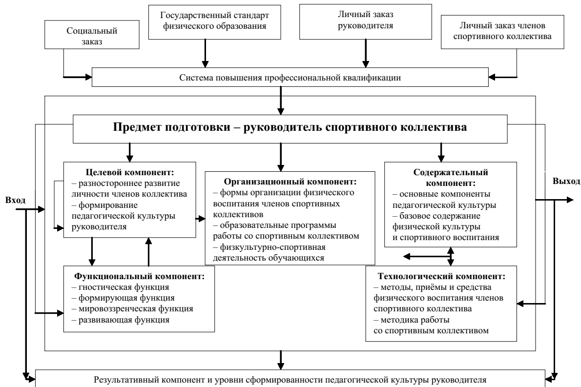
Схема 1. Структурно-функциональная модель

Эти выводы применимы к профессиональной деятельности руководителя спортивным коллективом.