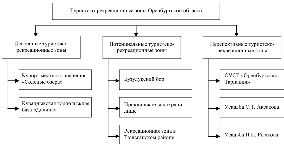
Рисунок 2. Туристско-рекреационные зоны Оренбургской области

Выработка механизмов формирования и развития туристско-рекреационного комплекса «Соленые озера» позволит отработать дан-