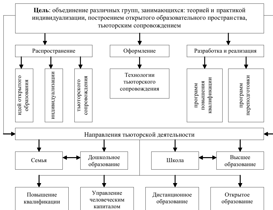
Рисунок 2. Деятельность Межрегиональной тьюторской Ассоциации

Следует отметить, что Приказами Минздравсоцразвития РФ от 5 мая 2008 года №216н и №217н (зарегистрированы в Минюсте РФ 22 мая 2008 г. №11731 и №11725 соответственно) утверждены профессиональные квалификационные группы должностей работников общего, высшего и дополнительного профессионального образования, в том числе, должность тьютор . Приказом Минздравсоцразвития РФ от от 14 августа 2009 г. N 593 утвержден Единый квалификационный справочник должностей руководителей, специалистов и служащих, раздел