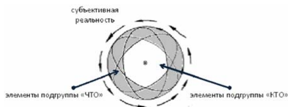
Рисунок 2. Субъективная реальность как совокупность элементов двух подгрупп «ЧТО–КТО»