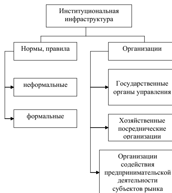
Рисунок 1. Институциональная инфраструктура рынка

Дается определение институциональной инфраструктуры региона, но не продовольственного рынка. Например, А. Осипов определяет институциональную инфраструктуру региона как систему методов воздействия центральных и региональных органов управления на экономику и общество, которая создает необходимые организационные условия для комплексного развития народного хозяйства [8, с.246]. На наш взгляд, институциональная инфраструктура регионального