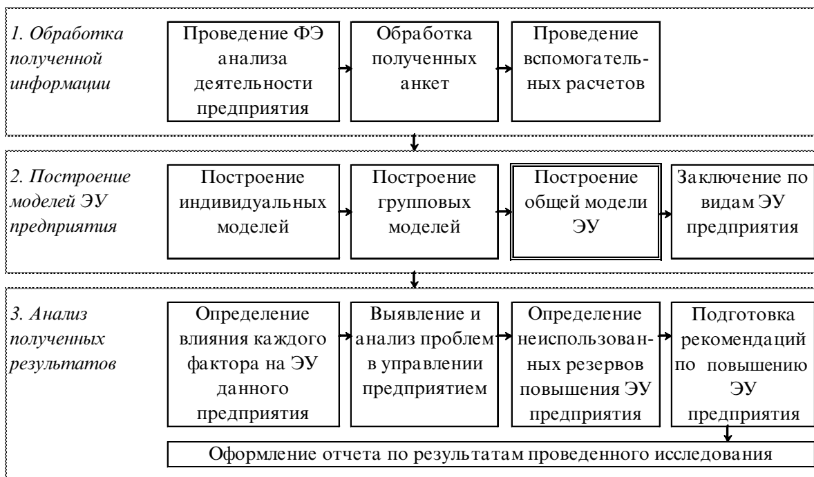
Рисунок 2. Оценка экономической устойчивости предприятия