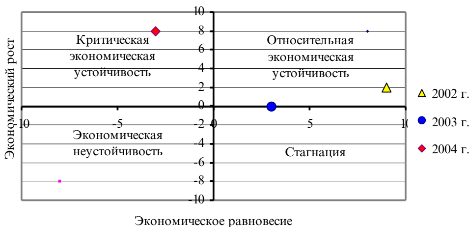
Рисунок 3. Динамика устойчивости ОАО «Корона-ТЭК» за 2002-2004 гг.

Таким образом, можно сделать вывод, что экономическая устойчивость ОАО «Ко-