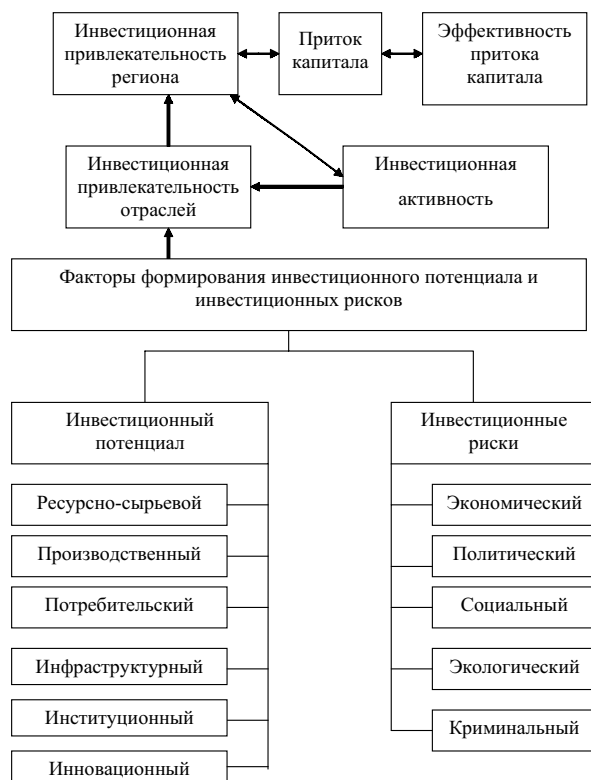
Рисунок 1. Алгоритм формирования инвестиционной привлекательности региона