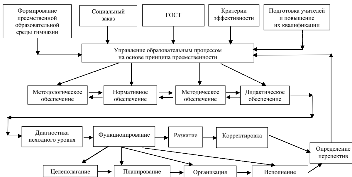
Схема 1. Организационная модель преемственного управления гимназией