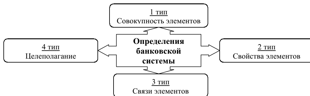
Рисунок 1. Типологизация определений «банковской системы»