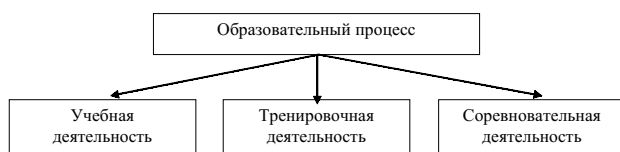
Рисунок 1. Компоненты планирования образовательного процесса в психологической подготовке специалистов физической культуры и спорта

Образовательные блоки представляют собой определенный «шаги образованности». Они характеризуются законченностью освоения части учебной информации. Эти блоки имеют свою структуру периодов обучения: