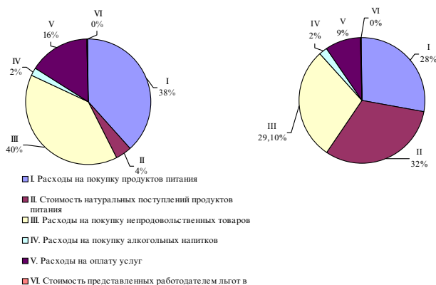
Рисунок 1. Структура расходов на конечное потребление домашних хозяйств Оренбургской области в 2003 г. [5, с.146]

Первая децильная группа включает население с самым низким уровнем доходов, десятая группа – с самым высоким. Как видно из рисунка 2, в первой децильной группе населения 63,3% расходов составляют продукты питания, 18,4% – непродовольственные товары и 16,8% – оплата услуг. Структура расходов десятой децильной группы резко отличается: преоблада-