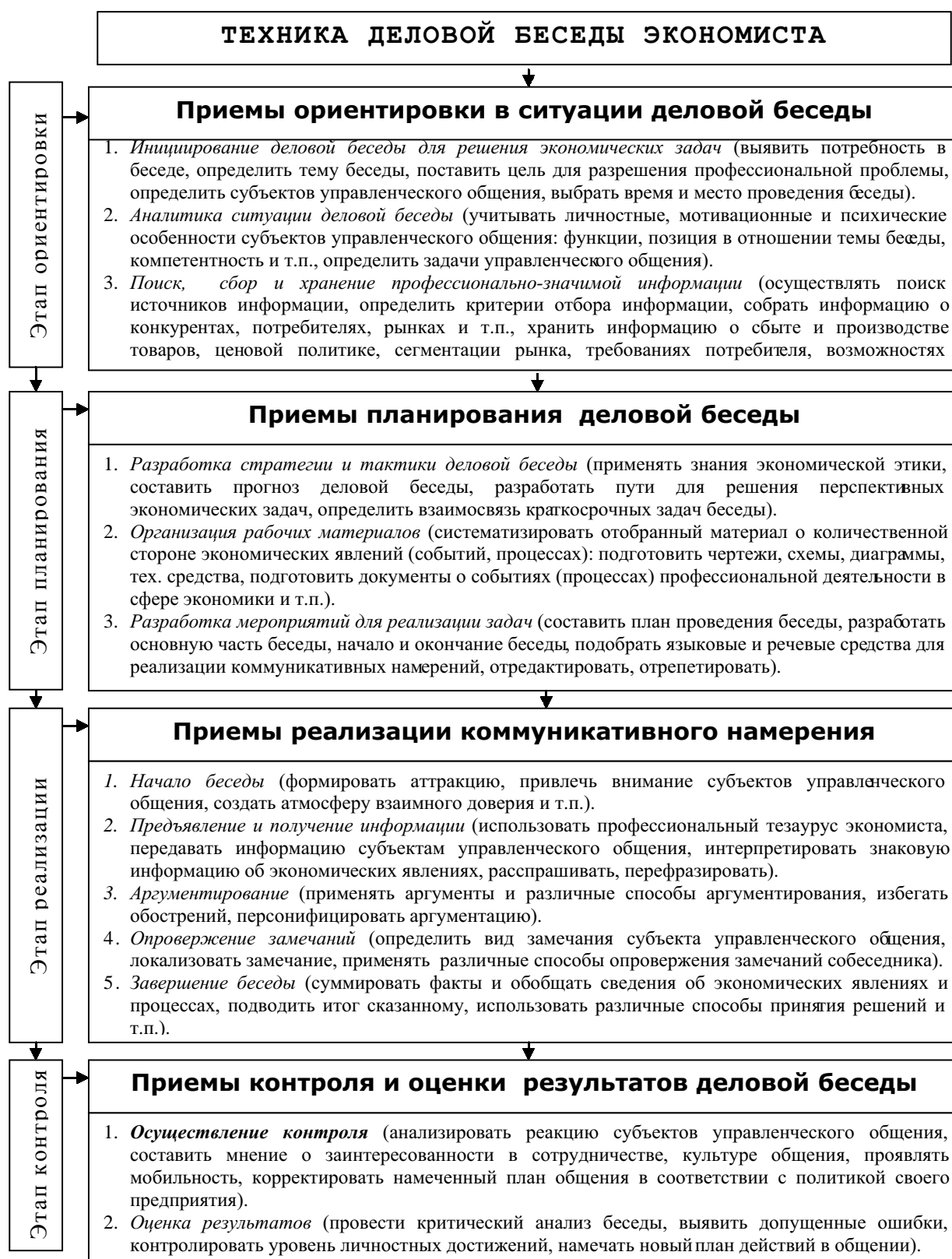
Рисунок. 1 Содержание техники деловой беседы экономиста