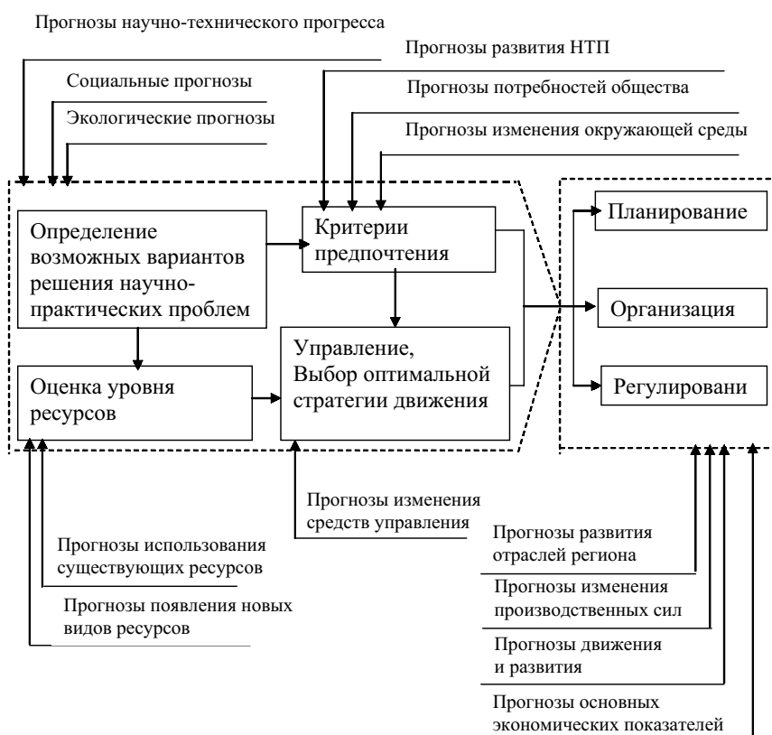
Рисунок 1. Роль прогнозирования в принятии управленческих решений

или какой-то производственный процесс. На выходе системы получается информация о возможном развитии ситуации. Обобщенная структура прогнозирующей системы представлена на рисунке 2.