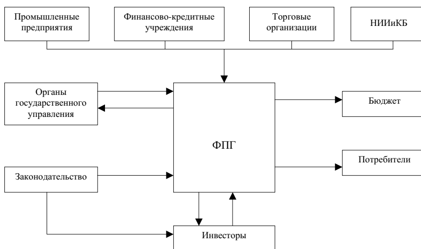
Рисунок 3. Схема функционирования ФПГ.

Таким образом, в современных условиях основным направлением повышения уровня региональной интеграции предприятий промышленных узлов является формирование различных интегрированных структур при поддержке местных органов власти, которые должны содействовать развитию внутриобластной кооперации между предприятиями и организациями Оренбургской области.