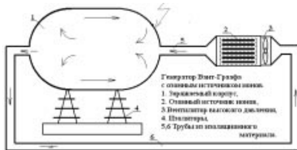
Рисунок 2. Генератор Ван-де-Граафа с озонным источником ионов: 1 – заряжаемый корпус, 2 – озонатор, 3 – вентилятор высокого давления, 4 – изоляторы, 5, 6 – трубы из изоляционного материала.

Подсчет по формулам (3) и (4) при скорости потока газа V_{turb} = 10 м/с и площади электродов озонатора – 0,1 \text{ м}^2 и L_{can} = 1,5 м дает плотность электрического заряда в разрядном промежутке озонатора в отрицательный полупериод работы его металлического электрода, равную 5,69 \cdot 10^{-3} к /м 3 , а ток из озонатора 5,5 мА. Это очень существенный ток, поэтому, действительно, барьерные электрические озонаторы с турбулентным режимом течения озонируемого газа можно использовать в качестве источников отрицательного электричества и в качестве транспортера зарядов в генератор статического электричества (генератор Ван-де-Граафа [1]) и для коагуляции аэрозольных положительно заряженных частиц в воздухе.