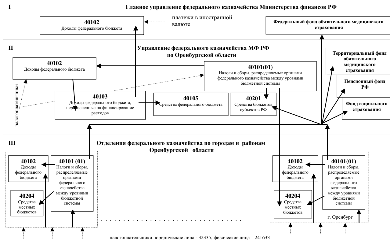
Рисунок 1. Модель казначейского управления доходами бюджетов в 1998-1999 гг. (I)

– не был предусмотрен анализ соблюдения нормативов межбюджетного регулирования;