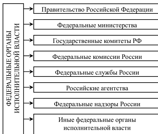
Рисунок 1. Структура федеральных органов исполнительной власти

Новым уровнем государственно-административного управления является создание семи федеральных округов: Центрального, Северо-Западного, Южного, Приволжского, Уральского, Сибирского, Дальневосточного.