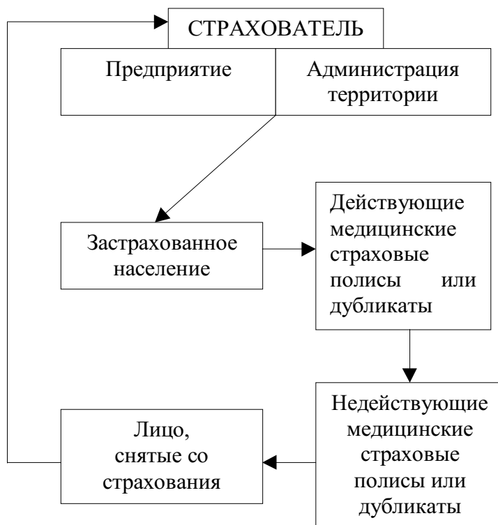
Схема № 2. Система формирования баз данных страхователей, застрахованных и медицинских страховых полисов.